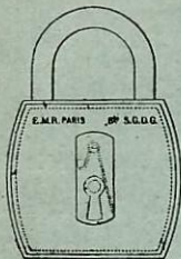
Cadenas " INVOLABLE " à couvercle encastré

Fournisseurs des chemins de fer Français et Étrangers