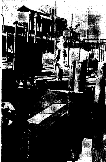
Så angörs färjeläget och strax efteråt drar en lokomotor vagnarna från pråmen.

spåriga till normalspåriga vagnar, som på smalspårslinjen transporteras upplastade på överföringsvagnar.